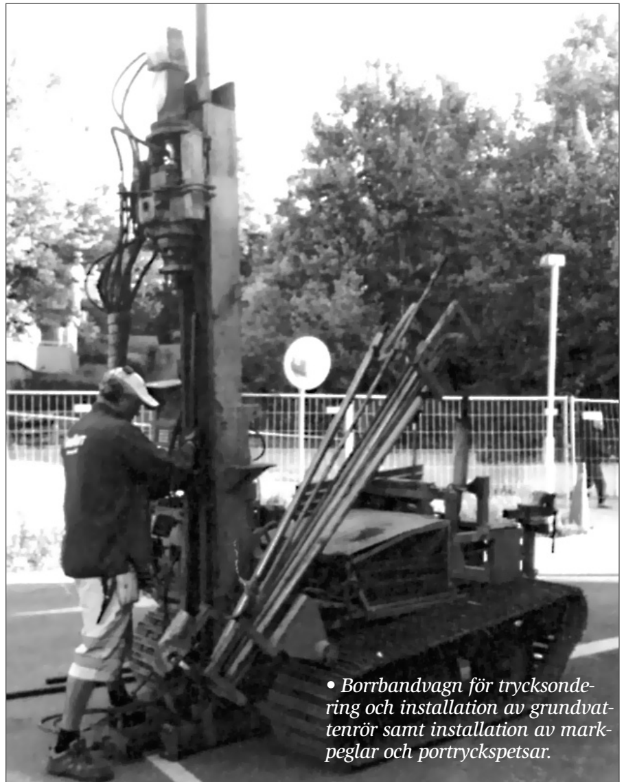
• Borrbandvagn för trycksondering och installation av grundvattenrör samt installation av markpeglar och portryckspetsar.

Efter att styrelsen framfört sin oro över den sprickbildning som redan finns i fastigheten Kirunagatan 38-46 och risken för att denna skall förvärras under byggtiden lovade TRV att genomföra en besiktning av fastigheten före byggstart för att nyuppkomna sprickor lättare ska kunna påvisas.